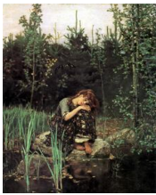
Образовательные исследования 2012

420-летию со дня рождения Яна Амоса Коменского (1592-1670 г.г.)